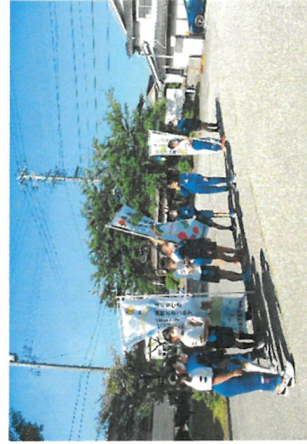
元気いっぱいボランティア

朝、児童玄関前に立っています。様々な表情をした子供たちが登校してきます。その表情は、楽しげだったり、沈んでいたりと、眠そうだったり・・・きつと家にいる間にいろいろなことがあったり、今日の学校のことを考えたりしているのだからと想像しますが、そんな子供たちの気持ちを一日の学校生活のスタートラインに立たせてくれるスィッチが朝一番の挨拶だと